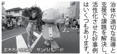
志木市いろは市 サンパレード

から社会的規制へと転換していききました。加えて、自動車の普及・増加の影響もあり、郊外への大規模小売店舗の出店が進みました。このことにより、商店街を中心とする中心市街地は空洞化していききました。近年では、情報技術の進歩によりEC市場(電子商取引)が拡大しており、リアル店舗(実物を見て購入)とネット販売の競争が起るなど、商店街の状況はますます厳しくなっています。