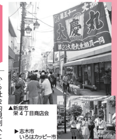
▲新座市 栄4丁目商店会 ▶志木市 いろはカッピー市