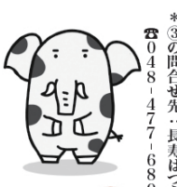
計画の詳細はこちら

◆基本理念◆ 支え合い、つながり合い、全ての高齢者が尊厳を持って自分らしい生活が送れる、活力ある「健康長寿のまち」の実現 ◆基本目標◆ 地域共生社会の実現に向けた、地域包括ケアシステムの深化・推進、誰もが住み慣れた地域で在宅生活を送れるまちを目指して、